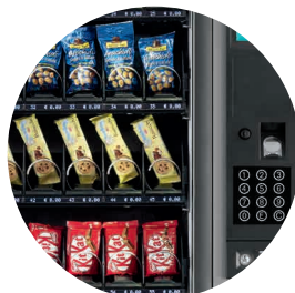
Design élégant et épuré