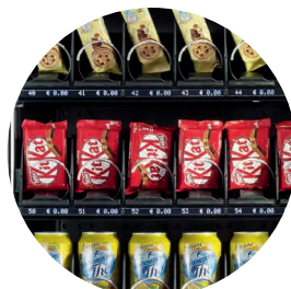
Haute visibilité de la cellule